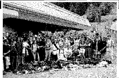
TOUS AZIMUTS Summit Foundation multiplie les actions, comme ici une journée de nettoyage hors saison à Morgins avec 250 élèves et 2 snowriders professionnels.

La responsabilité écologique de la fondation a été récompensée dernièrement par le trophée Eco-conscience décerné conjointement par le Beau-Rivage Palace et la Ville de Lausanne. Berne a également reconnu l'utilité de l'organisation. Elle lui a octroyé cette année un